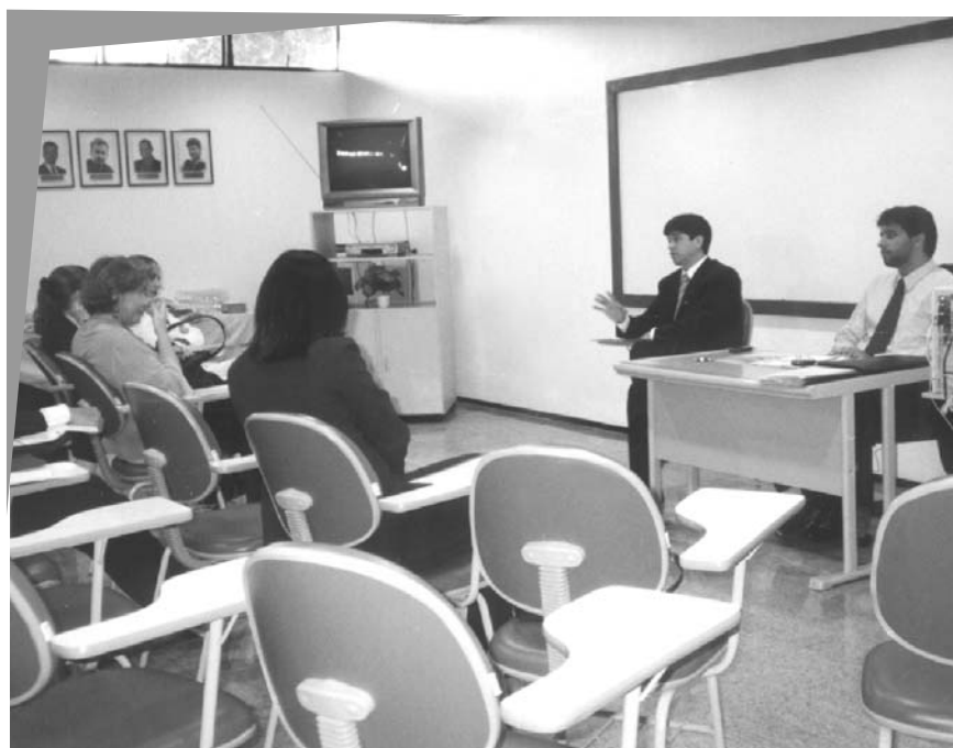
Assembléia Geral da AMATRA 21: Sócios da AMATRA 21 e Presidente da ANAMATRA prestigiaram a primeira reunião da nova diretoria

Depois de encerrada a pauta de votação, os associados presentes participaram de um tradicional 'happy hour'.