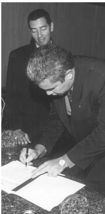
Membros da Diretoria oficializando o recebimento do cargo